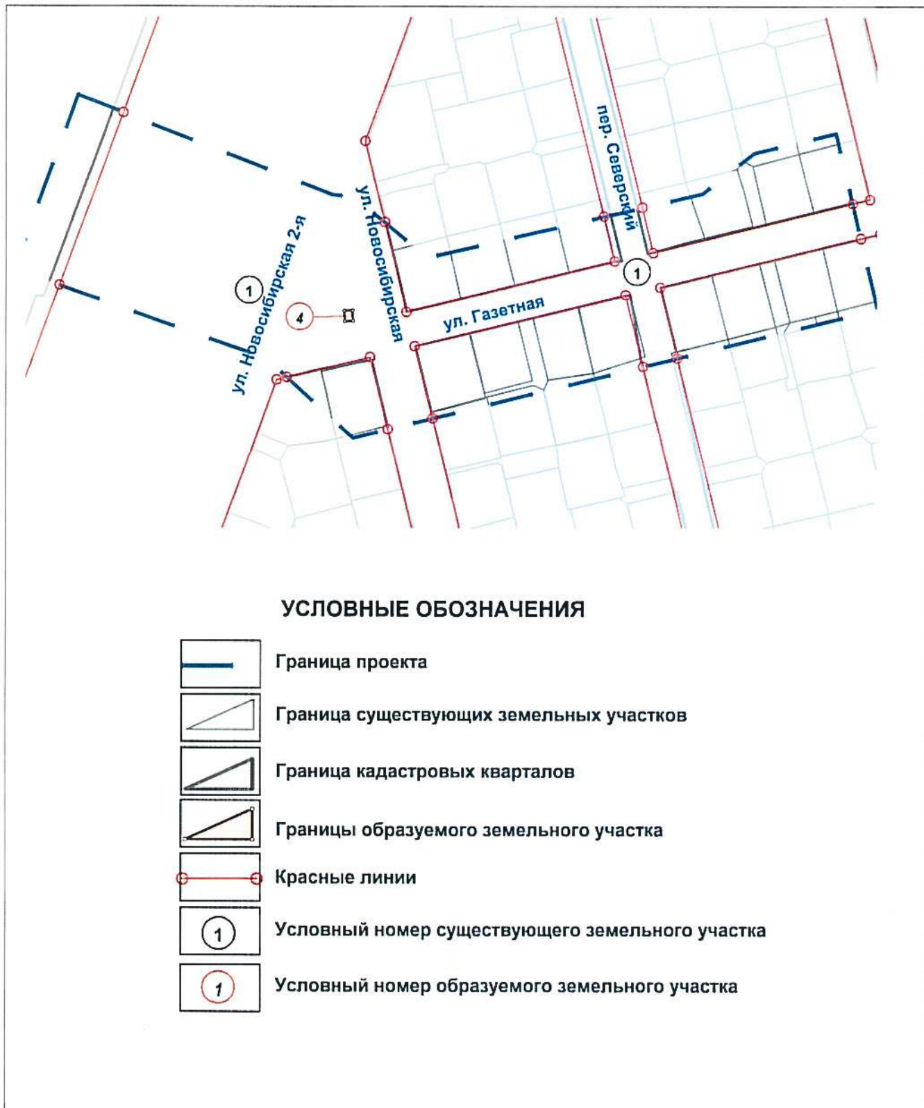
Схема межевания территории (на расчетный срок)