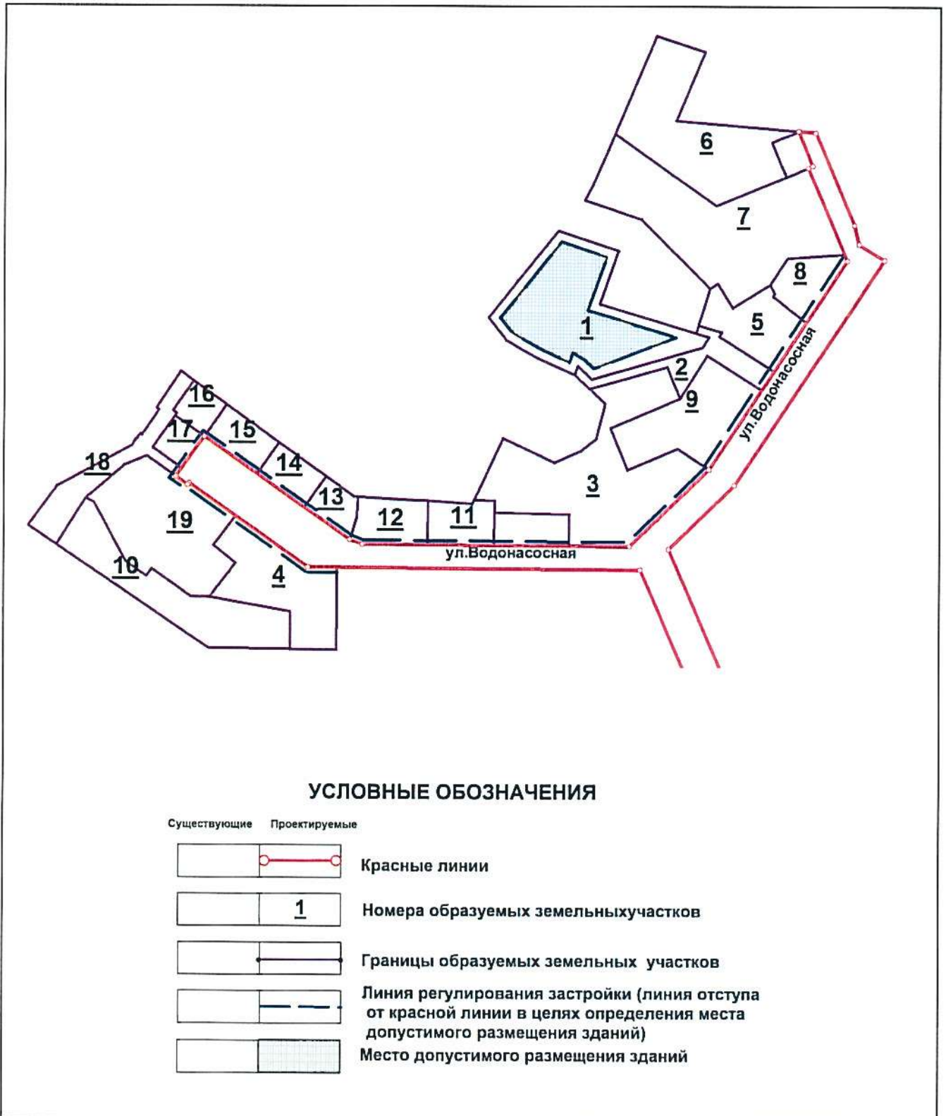
Схема межевания территории

Приложение № 1 к приказу Министерства строительства и развития инфраструктуры Свердловской области от 05.05.2018 , № 515-17