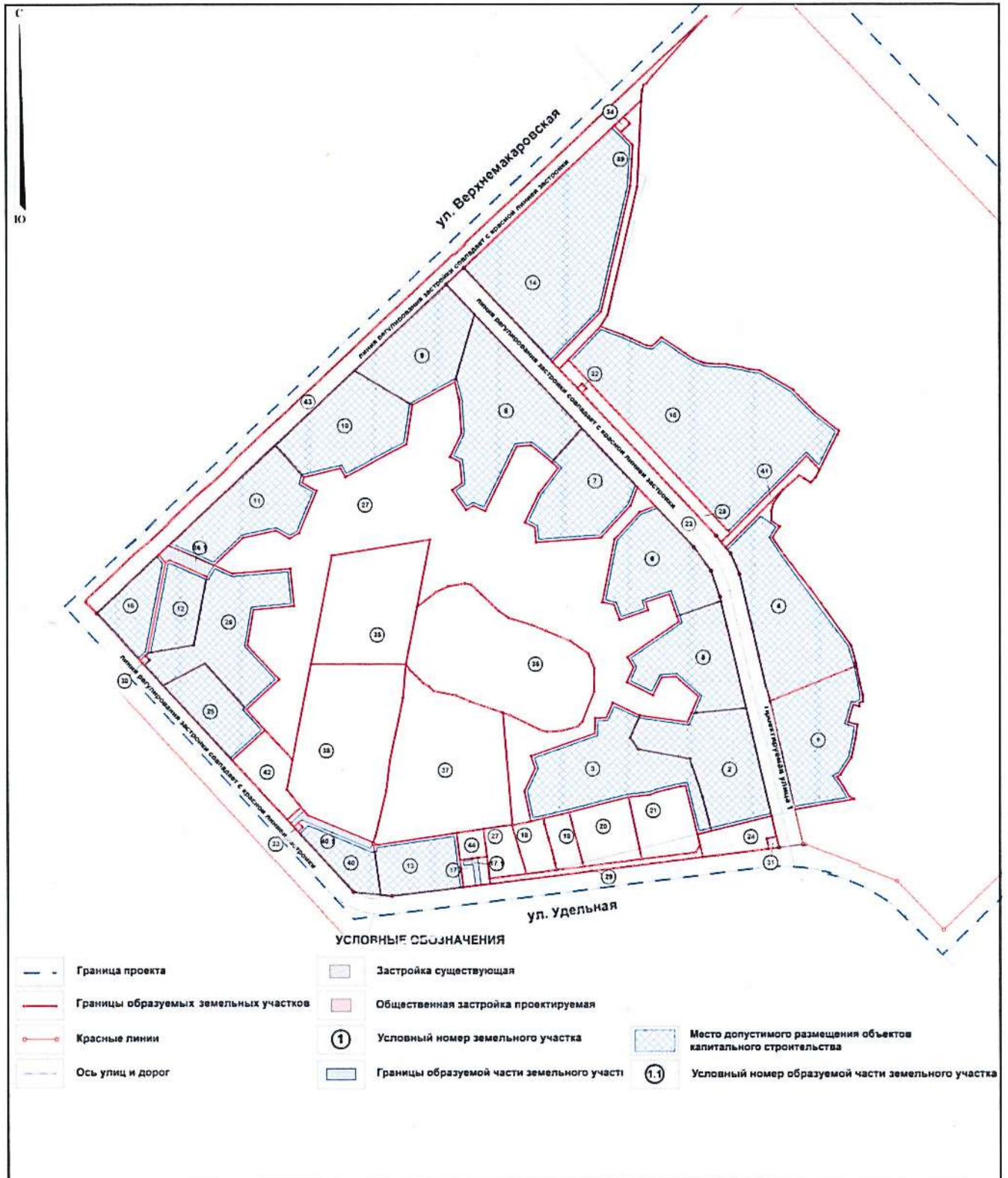
Схема межевания территории

Приложение № 3 к приказу Министерства строительства и развития инфраструктуры Свердловской области от 30.10. № 1114-17