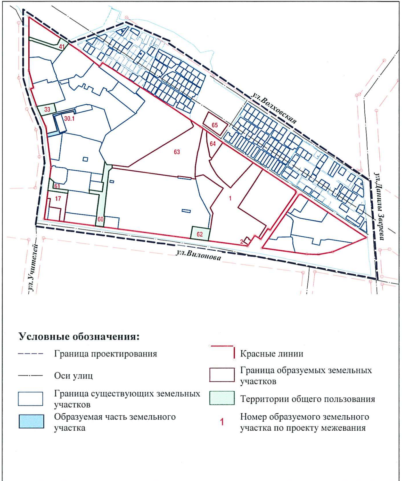
Схема межевания территории

Приложение № 3 к приказу Министерства строительства и развития инфраструктуры Свердловской области от 16.11.2014 № 1199-17