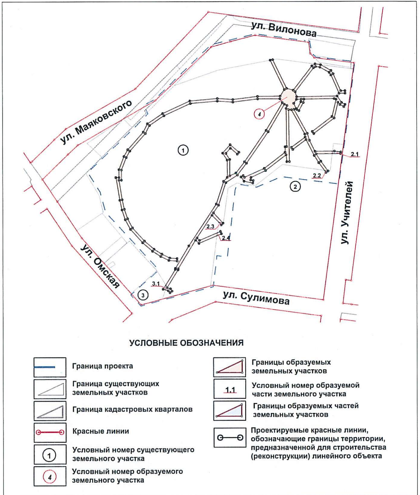
Схема межевания территории (на период строительства)

Приложение № 5 к приказу Министерства строительства и развития инфраструктуры Свердловской области от 15.12.2017г. № 1324-П