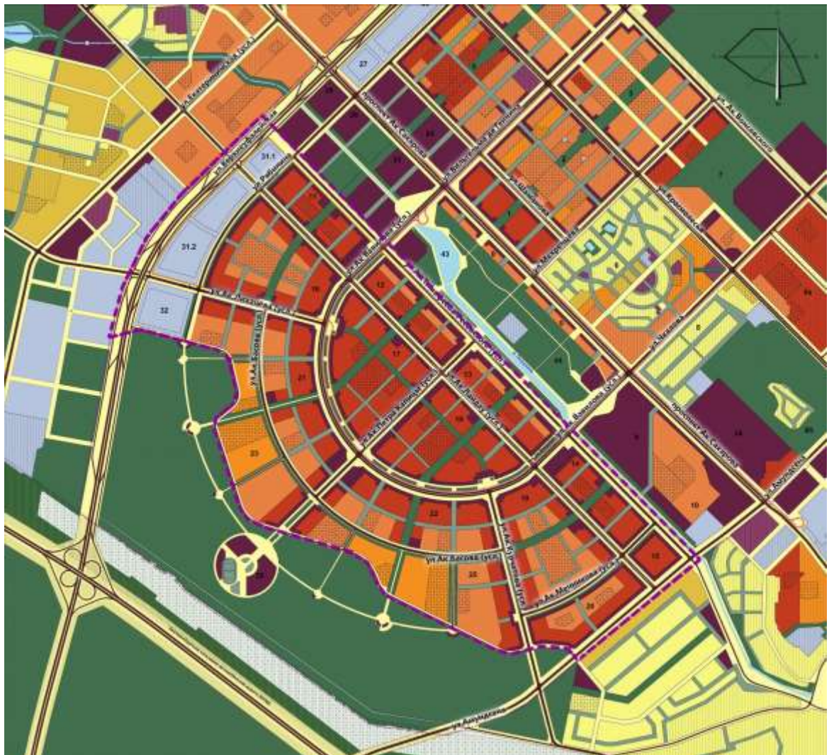
Схема функционального зонирования территории второй очереди жилого района «Академический»