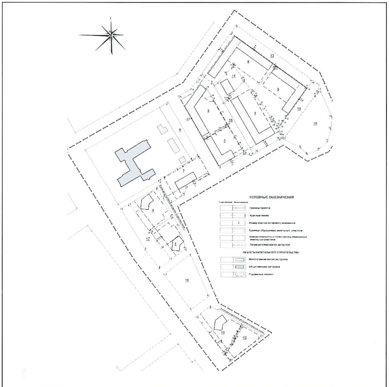
Схема межевания территории (на период строительства)

Приложение № 6 к приказу Министерства строительства и развития инфраструктуры Свердловской области от 08.06.2017 № 410-П